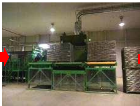
空になったコンテナを左へ移動