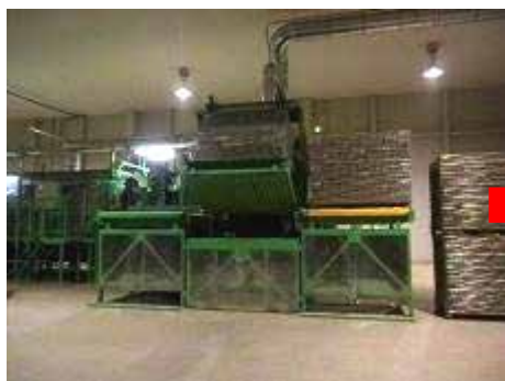
受入ホッパーへ原料を投入