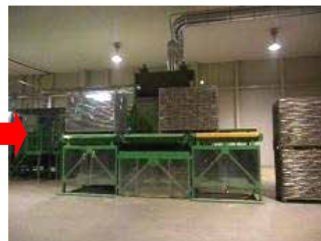
右にあった原料コンテナを中央へ移動