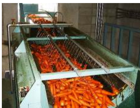
洗浄前に葉屑を取り除きます

人参の送りはブラシの回転速度で調整することが可能で、任意に調節できるようにインバーター制御を設けております。またインバーター制御することにより、クッションスタート機能もございますので、機械の起動時の衝撃がなく、軸受けやその他部品の消耗も軽減されます。