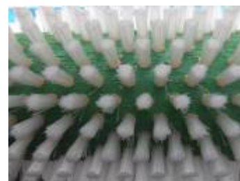
ブラシの斜植毛状況

ブラシの回転速度もインバーターにより変えられ、また出口部では出口開閉部にウェイトを用い、洗浄機からの排出量の調節(洗浄状態の調整)が簡単に行えます。