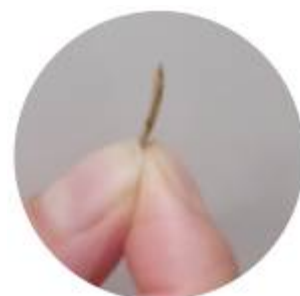
薄くむけるので歩留まりアップ

水洗式は土砂汚れがひどい原料の場合などに大活躍。更に、水洗することにより機器の清掃も簡略化できます。