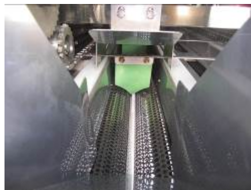
オプションの供給装置を設置した状態です

また、供給装置(オプション)を使用した場合、連続で定量供給ができ、安定した作業効率につながります。また、人手による供給が簡略化され、人員の削減につながります。