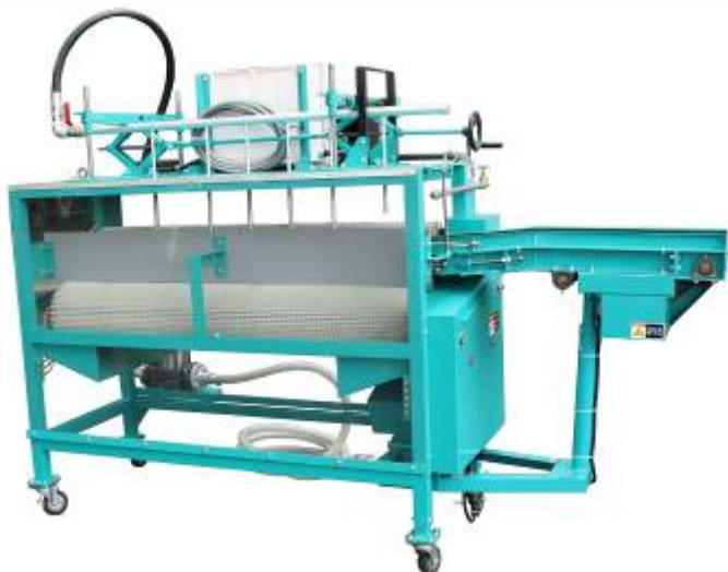
投入コンベヤーはオプションです。

3Sは 洗浄機と洗浄ポンプが一体 となっており、その分省スペースで使用できることが一番の特徴です。